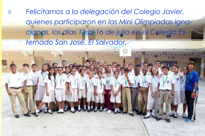
◊ Felicitamos a la delegación del Colegio Javier, quienes participaron en las Mini Olimpiadas Ignacianas, los días 13 al 16 de julio en el Colegio Externado San José, El Salvador.

Diálogo entre Fe y Cultura. Promoviendo un diálogo abierto, permanente y constructivo que pueda conciliar Fe y Cultura.